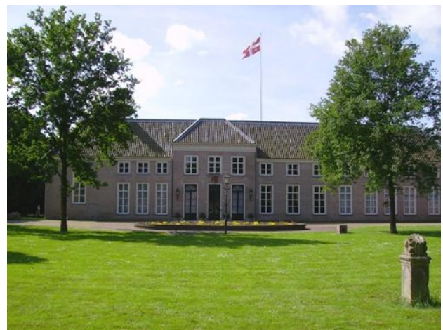
Landgoed OldRuitenborgh te Vollenhove

Een oplossing blijkt vaak wel voorhanden, maar het kost tijd voordat een kerkgebouw van eigenaar verandert. Het is dan ook van belang dat men in heel vroeg stadium aanklopt om advies. Omdat er vrijwel altijd sprake is van een bestemmingswijziging, welke procedure minimaal 6 maanden in beslag neemt is het van belang om in vroeg stadium mogelijke verkoop te melden. Dan kan er een inventarisatie gemaakt worden. De waarde van een kerkgebouw hangt grotendeels af van de mogelijke gebruikers. Als een kerkbestuur wil dat het gebouw als kerk in gebruik blijft, is het aantal potentiële kopers een stuk kleiner. Het is mooi als een gebouw in oorspronkelijke staat behouden kan blijven. Bovendien is het voor de voormalige eigenaars vaak een troost als de kerk toch nog voor de eredienst gebruikt wordt. Vooral jonge, groeiende gemeenten gaan op zoek naar een gebruikt kerkgebouw. Als de verkoop aan een ander kerkgenootschap niet lukt, wordt gekeken naar herontwikkelingsmogelijkheden. Dat moet wel een beetje passen bij het karakter van het gebouw. Een sociaal-maatschappelijke functie bijvoorbeeld, een huisartsenpost of een kinderdagverblijf heeft de voorkeur. Recent is een bijzonder kerkgebouw van Berlage in Den Haag verkocht met als bestemming een mogelijk museum. Een bestemmingswijziging voor horeca of supermarkt wordt veelal niet geapprecieerd door de oorspronkelijke eigenaren.